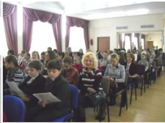
128 ребят из 8 районов города пришли на открытие фестиваля