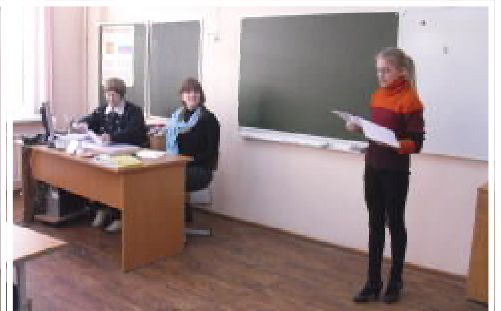
На четырёх секциях «Родословная», «Стихотворение о семье, о близких людях», «Рассказы о людях, которые сыграли большую роль в вашей жизни» и «Очерки и рассказы о своих предках», которые расположились в шести кабинетах школы, ребята представили свои работы на суд строго жюри и зрителей.