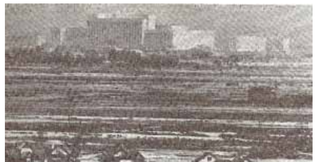
Начало застройки южной части Московского района. Пустырь за Домом Советов

Если мы будем относиться к лестнице, на которой живем, так же, как к своей квартире, если начнем к своему двору относиться так, как к своей собственной комнате... А если к району... А если к городу... А если к стране... Представляете, как заживем?