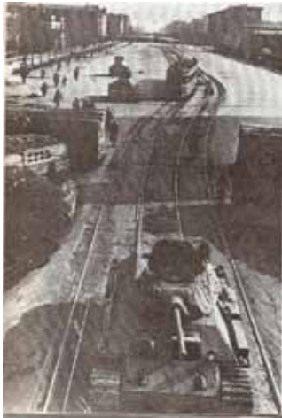
Московский проспект в районе Благодатной улицы в годы войны

Еще для меня очень памятна экскурсия в Дом Советов. Это здание имеет удивительную историю. В нем должен был находиться новый архитектурный центр Санкт-Петербурга. По задумкам архитектора Троицкого, было спроектировано три площади. Но до войны успели построить только сам Дом Советов. Нас, школьников, водили в огромный актовый зал, который строился как конгресс для съездов. Помимо роскошного оформления, меня поразила карта Советского Союза, сделанная из