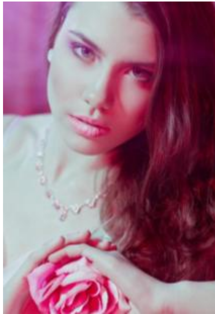
«День Святого Валентина»

Детство – пора грёз и фантазий. Кто-то с ранних лет мечтал стать президентом, бизнесменом, артистом, а кто-то – учителем или врачом. А я, воображая себя успешной моделью, мастерила из разноцветных лоскутков ткани необычные наряды и «дефилировала» в них по квартире. Однако любимым моим занятием в те времена было позирование перед объективом фотокамеры. Теперь я не могу без улыбки просматривать свои детские фотографии в постаревших семейных альбомах.