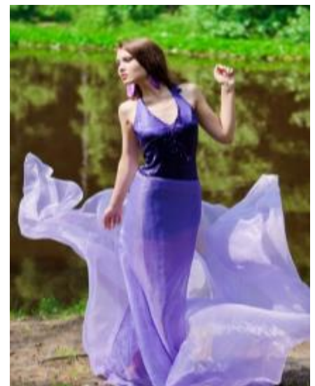
«Лесная нимфа»

Случайные открытия делают только подготовленные умы (Б.Паскаль)