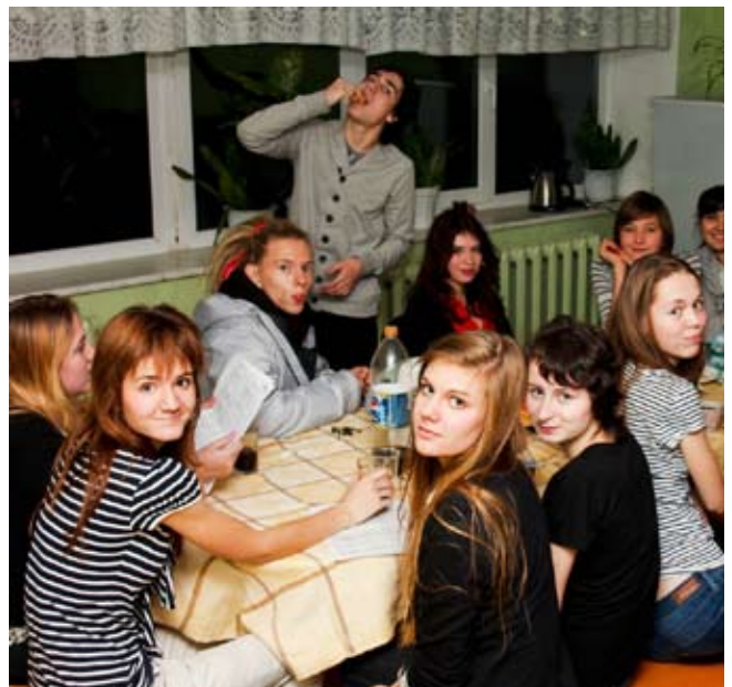
Главное – рабочий дух!

Журналист – профессия для молодых духов!