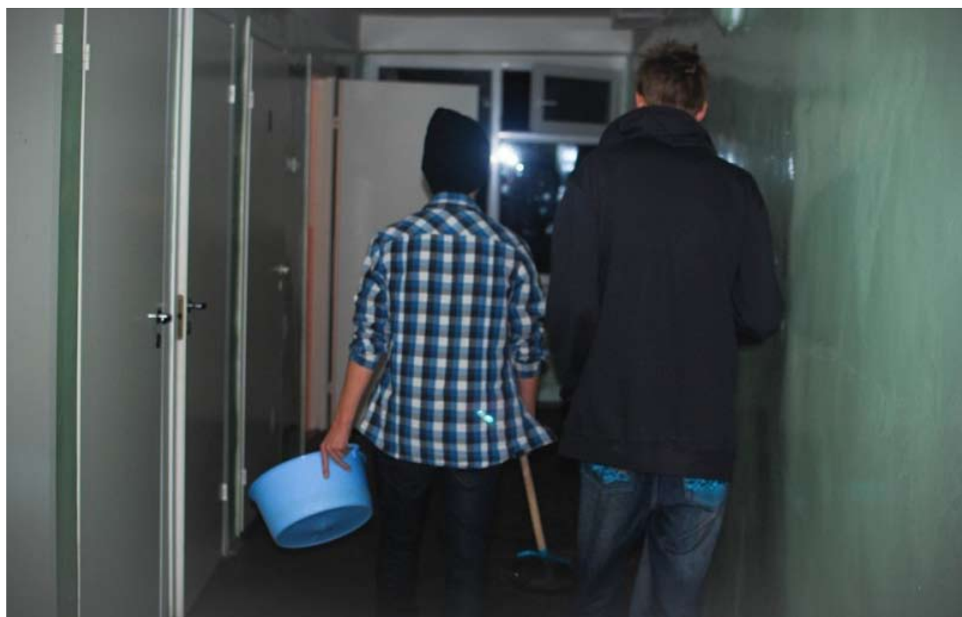
Мы уходим. Но мы еще обязательно вернемся...