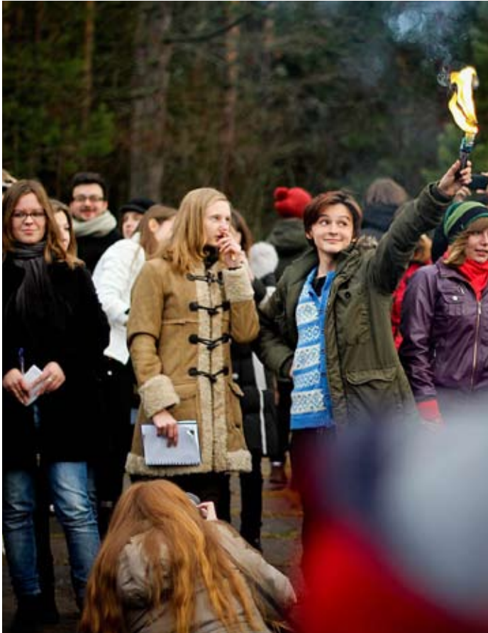
У корреспондентов есть своя Статуя Свободы.